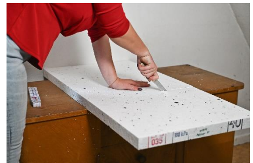
Abbildung 5: Platte mit dem Brotmesser schneiden.