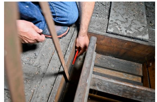
Abbildung 4: Anzeichnen von oben.

Aber wieviel kannst du? Bei unserer Luke sind das knapp 80 % der Wärme im Vergleich zu vorher. Das entspricht etwa 15 € pro Jahr. Und