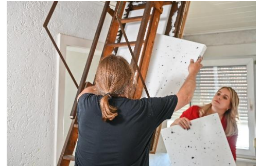
Abbildung 8: Einpuzzeln der zweiten Dämmschicht.

Wir wünschen dir alles Gute mit deinem Projekt.