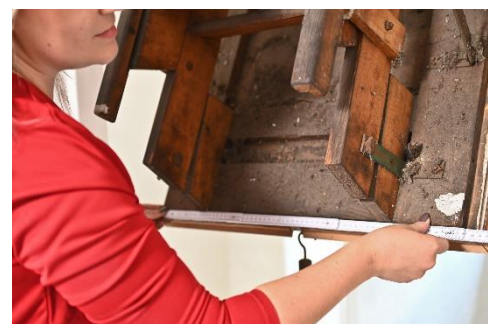
Abbildung 3: Ausmessen.