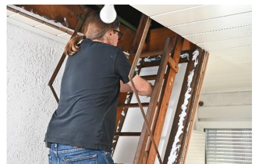
Abbildung 7: Die erste Dämmlage ist zwischen die Rahmenhölzer eingeklebt. Der Kleber für die 2. Schicht ist schon auf dem Rahmen und wird gerade zusätzlich auf die erste Dämmlage aufgetragen.